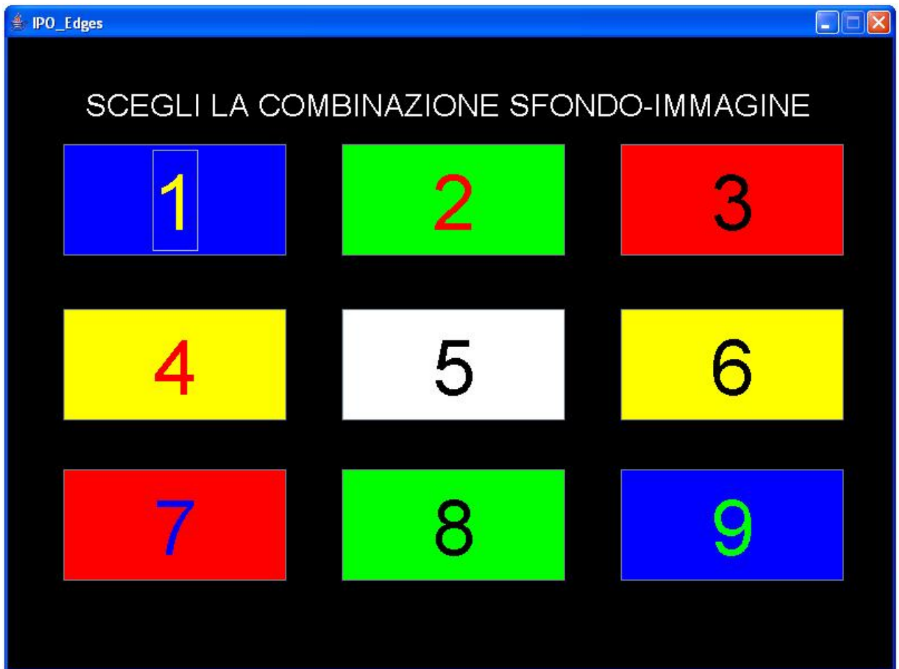
Fig. A1 Interfaccia iniziale di IPO_Edges

La prima interfaccia (Fig. A1) offre all'utente la possibilità di scegliere la combinazione di colori preferita.