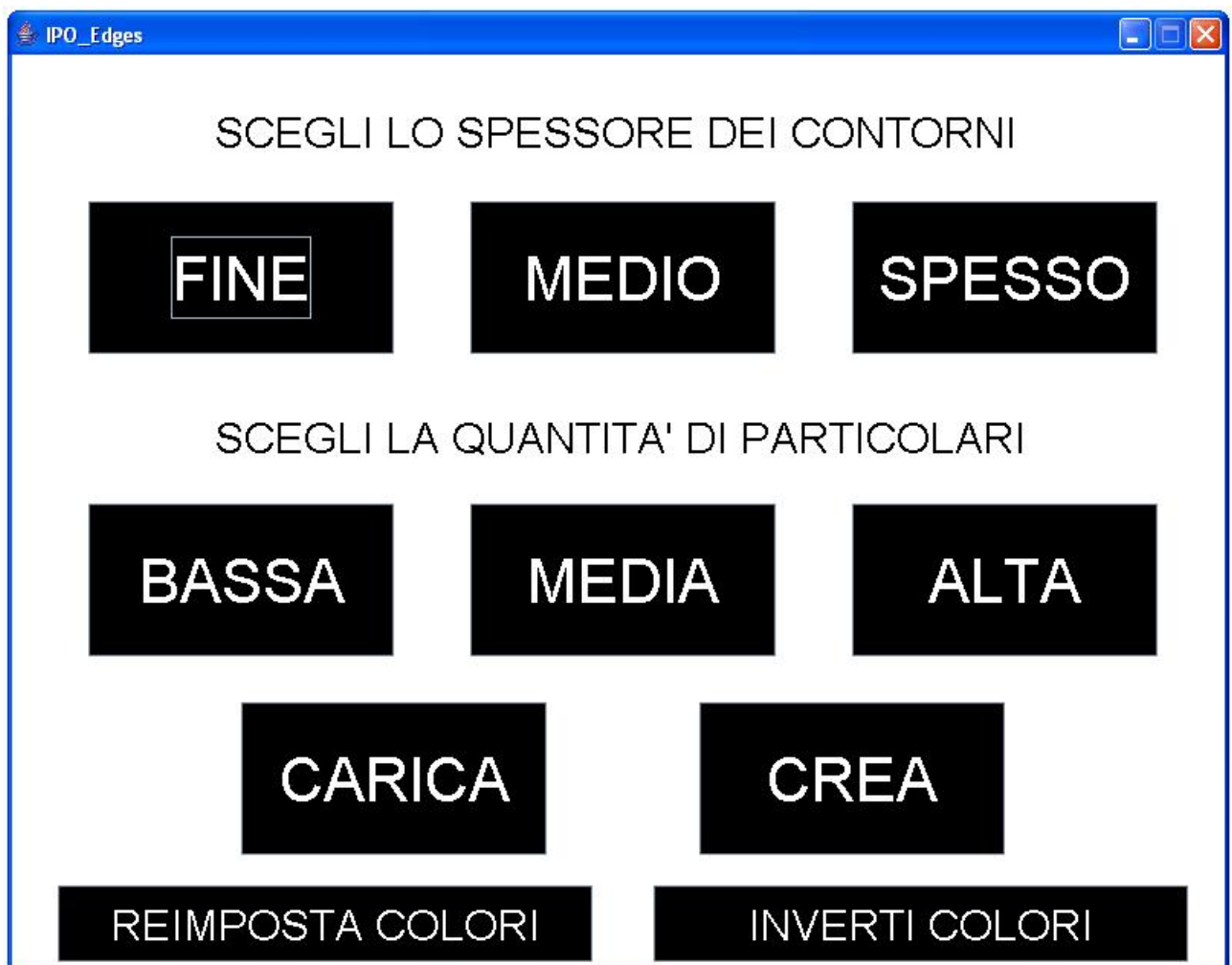
Fig. A2 La seconda interfaccia di IPO_Edges

quantità di dettagli da visualizzare, tornare all'interfaccia precedente per cambiare la combinazione di colori, invertire i colori impostati e il bottone per avviare l'elaborazione dell'immagine. La prossima immagine è visualizzata utilizzando la combinazione numero 5 – Bianco/Nero.